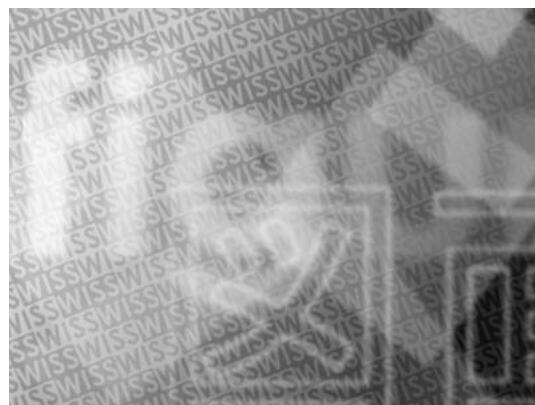
図 2. 図面の例

参考文献はJBIB \text{\LaTeX} を用いて文献データベースから自動生成することを強く推奨する. 文献スタイルは jwiss を使う. 手書きで作成する場合には, 文末の例のように著者名, 論文名, 所収冊子名 (英文の場合には斜体), ページ番号, 発行年の順で書く. 英文で著者名を書く場合には, 名 (first name) のイニシャル, 姓 (last name) の順に書く. 共著者が多