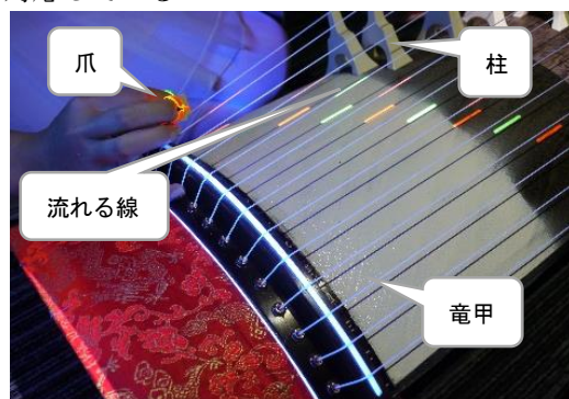
図 1. 投影時の様子

そこで、本稿では音楽表現を広げるための「奏法」に注目した箏の奏法支援システムを提案する(図 1)。提案システムは、プロジェクションマッピングによって箏の弦や竜甲に撥弦位置と奏法を提示する。また、爪輪に蛍光塗料を塗布することで正しい運指を行えるようにした。奏法は前述の奏法のうち 11 種類に対応している。