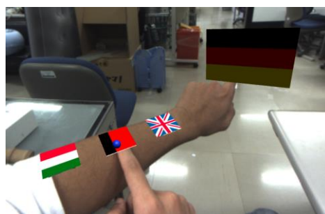
図1 タッチインタラクション