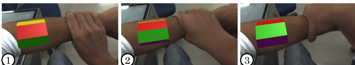
図3 回転インタラクション