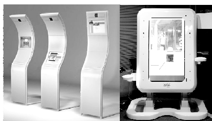
図 1. Smart Furniture

公共空間を対象とした多様なホットスポット端末が開発されている(図1)。ホットスポット端末を利用した様々なサービスの研究が行われている[1]。また、ユーザの行動に応じて部屋の位置をゾーンに分ける研究がなされてる[2]。これらの研究は、ゾーンに応じてサービスを切り替え、ユーザの嗜好を反映したサービス提供を可能にしている。