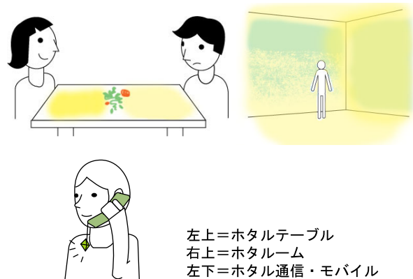
図 3. ホタル通信の応用例

ホタル通信を同時に複数人数で使う実験も行っていきたい。加えて、ホタル通信の機能を環境の中に埋め込んだ、ホタルテーブル（呼吸するテーブル）やホタルルーム（呼吸する部屋）（図 3）の実現を行っていく。また、ホタル通信を携帯電話に取付け「ホタル通信・モバイル」とし、相手の意図や感情をも汲み取れる通信システムへの応用も期待できる。