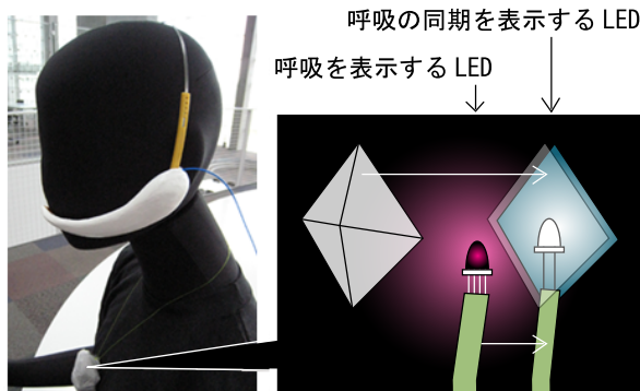
図 2. ホタル通信の形状