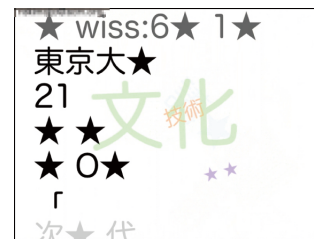
図 3. richbiff の画面例