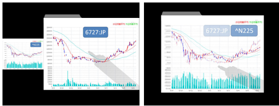
図 2. 複数枚のスライドを並べて・重ねて表示

このスライドサムネイルをペンによりタップすると、該当のスライドに切り替わる。これによって、自由な順にスライドを提示することができる。