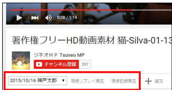
図 1. GazeTube を実装すると新たな項目が現れる

生する「視線記録再生」ボタン、記録された視線情報データをマーカー表示しながら再生する「視線リプレイ再生」ボタン、表示する視線記録を選択するプルダウンメニューの3つの項目が現れる(図1)。視線記録再生および視線リプレイ再生時には、動画に集中できるように全画面で動画を再生する仕様となっている。