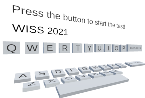
図 1. QWERTY 配列の上段のキーが上部、中段および下段のキーが下部に配置された仮想キーボード。

概要. VR 環境においても、ユーザの手指を用いた文字入力が行えれば、文字入力にコントローラが不要となる分、好都合である。ただし、3次元インタラクションにおいて、手指による奥方向のポインティング精度が低いという課題がある。さらに、ユーザに好まれる QWERTY 配列の仮想キーボードには、キーボード面が垂直であるために、ユーザが文字入力において手を上下左右に移動させる必要があるため、身体的負荷が高いという課題がある。そこで、我々は手首の屈曲および伸展を用いた文字入力手法を設計している。本手法では、QWERTY 配列の上段および中段のキーを手首の屈曲および伸展により、下段のキーを親指の屈曲を用いてタップすることにより文字が入力される。この設計により、奥方向のポインティングを必要とせず、かつ、文字入力に伴う手の移動量を抑えた QWERTY 配列の仮想キーボードを実現できる。